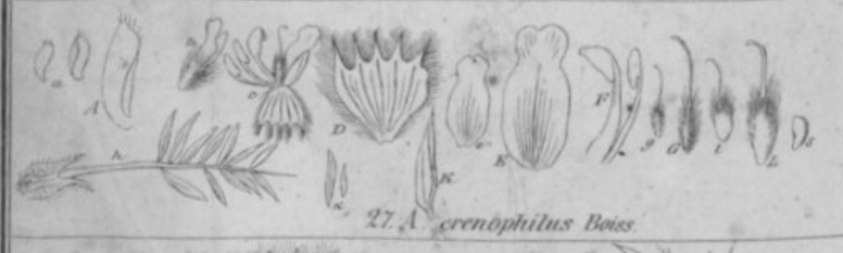
27. A. crenophilus Boiss.