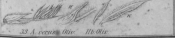
33. A. verus Oliv. Hb. Oliv.