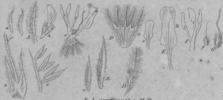
8. A. arnecantha M B.