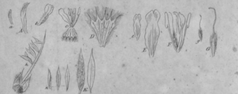
17. A. brachycentrus F.