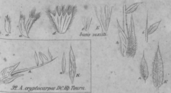
39. A. cryptocarpus DC. hb. Tourn.