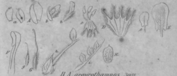
11. A. argyrotamnus Boiss.