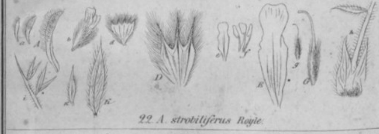
22. A. strobiliferus Royle.