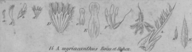
14. A. myriacanthus Boiss et Hohen.