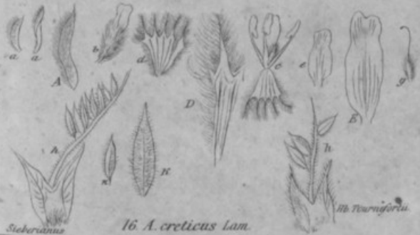
16. A. creticus Lam.