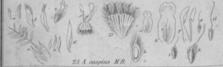
23. A. caspius MB.