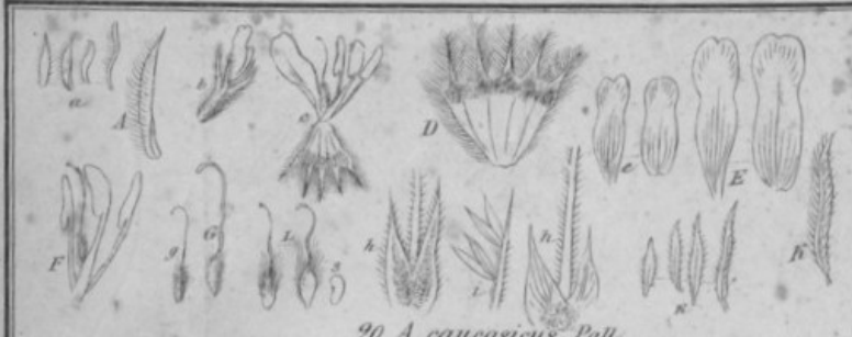
20. A. caucasicus Pall.