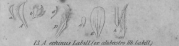
13. A. echinus Labill. (ex alabastro hb. Labill.)