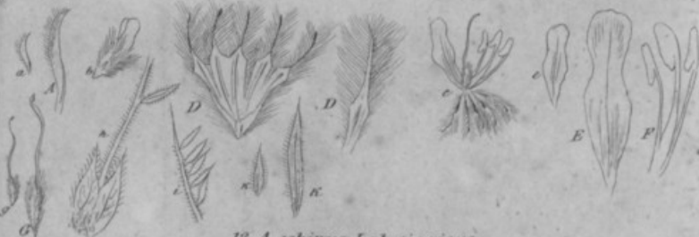
13. A. echinus Lab. sinaiticus