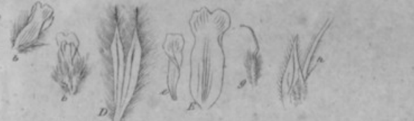
15. A. erianthus W. (ex hb. Willd.)