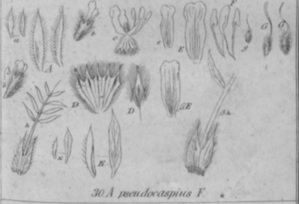
30. A. pseudocaspicus F.