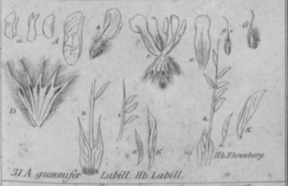
31. A. gummiifer Labill. Hb. Labill.