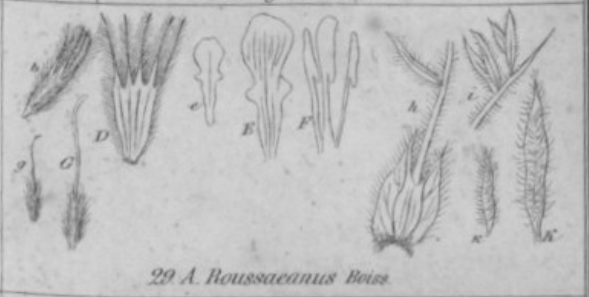
29. A. Boussacanus Boiss.