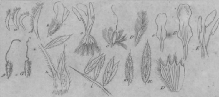
9. A. eriacantha Stev.