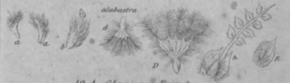
10. A. filagineus Boiss ?